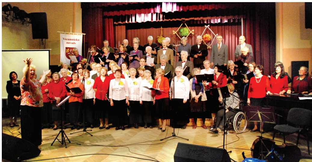
Koncerta izskaņā koru «Grendakoret», «Sarma» un «Atbalss» dalībnieki kopīgi izpildīja vairākas dziesmas.