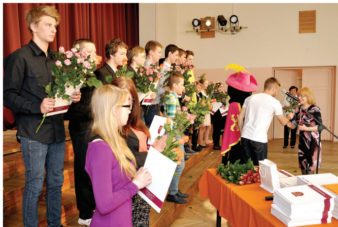
Apsveikumus saņem Skaistkalnes vidusskolas audzēkņi un skolotāji.

○ Sveic olimpiāžu veiksmīniekus un sekmīgākos audzēkņus