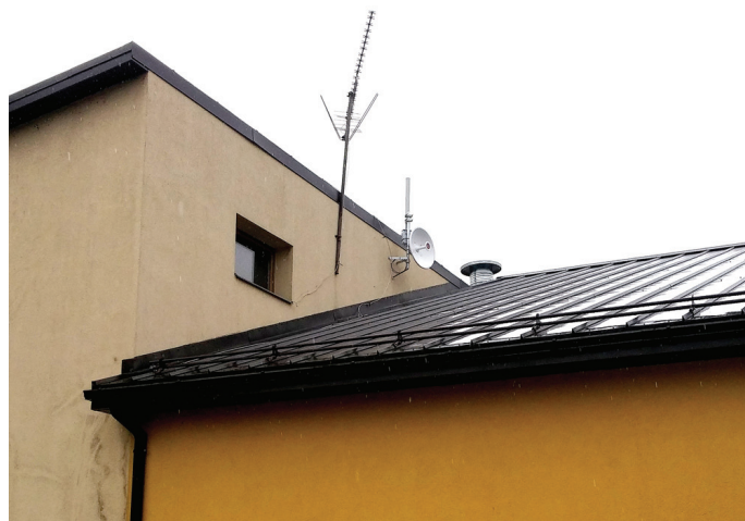
Bezvada interneta tīkla antena piestiprināta pie Skaistkalnes tautas nama ēkas sienas.

♦ Izveidots publiskā interneta pieejas punkts ar pieeju