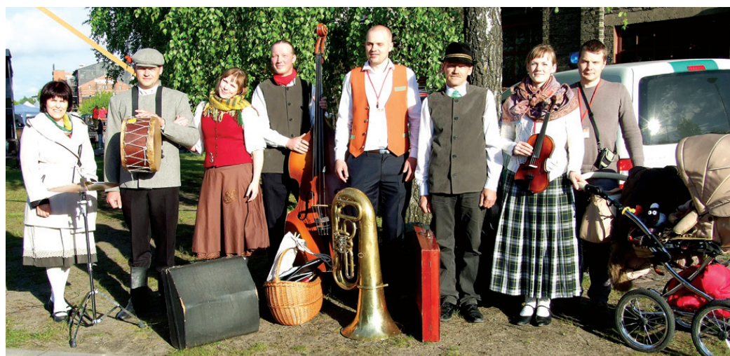
Lauku kapela «Savējie» Vecumnieku novadu pārstāvēja 18. Latvijas tautas mūzikas svētkos Liepājā.

Šīs pasākums tautas mūzikas ansambļiem, lauku kapelām un folkloras kopām bija īpašs, jo tika vērtētas kolektīvu prasmes. Dižkoncerts bija kā skate, kurā dalībniekiem vajadzēja izpildīt divus izvēles skaņdarbus.