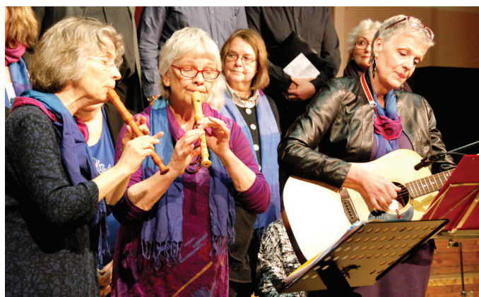
«Grendakoret» klausītājus pārsteidza ar skanīgu priekšnesumu.