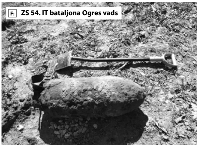
F: ZS 54. IT bataljona Ogres vads

Sprādzienbīstamais priekšmets Mazajā ielā 2 atrasts pirmdienas, 28. maija, vakarā, veicot zoga ierīkošanas darbus, informē Zemessardzes 54. inženier tehniskā bataljona Nesprāgušās municijas neitralizēšanas (NMN) rotā. Otrdien notikuma vietā strādāja karavīri no NMN 2. Ogres vada, kas 100 kilogramu smago aviācijas bumbu policijas vadībā nogādāja Ādažos iznīcināšanai. Otrdien no rīta, gaidot sapieru ierašanos, Valsts policija organizēja iedzīvotāju evakuāciju no sprādzienbīstamās zonas, tostarp no izglītības iestādēm, kā arī uz laiku tika slēgta satiksme uz Rīgas-Bauskas šosejas (A7).