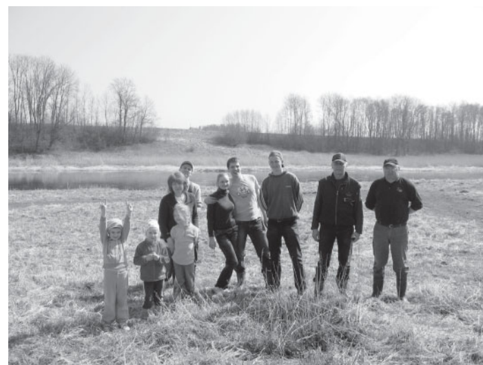
Gailišu pagasta Uzvaras talkotāju pulciņš priecājas par paveikto