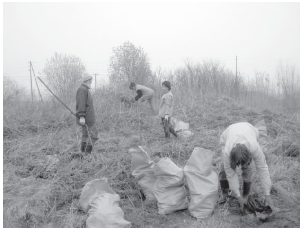
Codieši Lielajā talkā sāka sakārtot teritoriju, kur nākotnē iecerēta atpūtas vieta