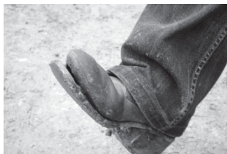
“Es ar būtu līdzī lec’s, man tā kurpe pušu...”