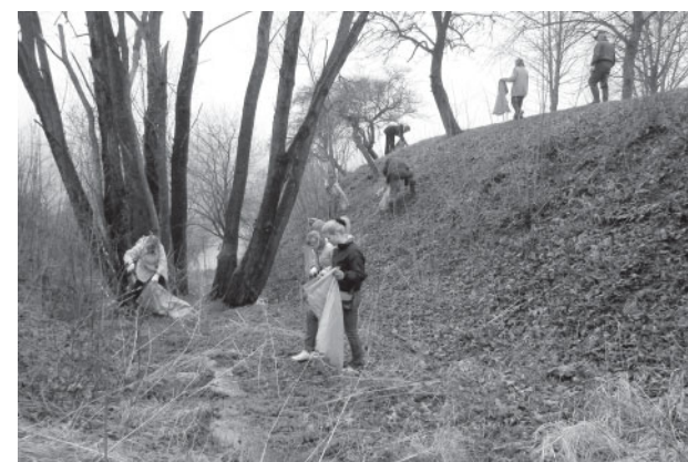
Bauskas talcinieki sakopj gravu Mūsas upes krastā pie trošu tilta