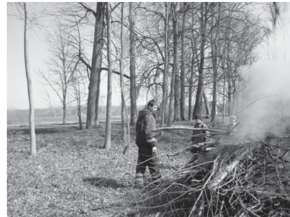
Cīņa ar pērnajām lapām un kritušajiem zariem Gailišu pagasta Pāces ciema parkā