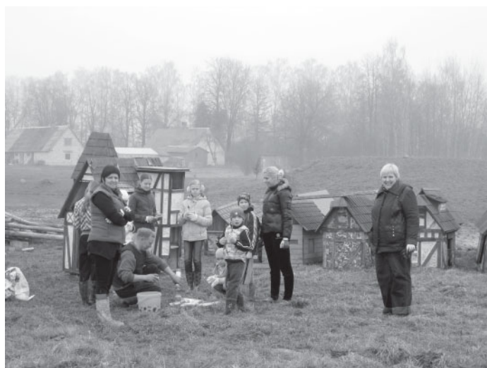
Uzpuccēt Trušu pilsētiņu Codē bija ieradušies arī ciemiņi no Bauskas un Rīgas