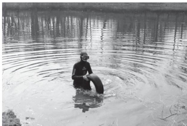
Ceraukstes pagasta Mūsas ciemā darbs atradās pat ūdenslīdējam