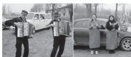
Par jauku atmosfēru un talkotāju vēderiem rūpējās T/C RIMI PALDIES!