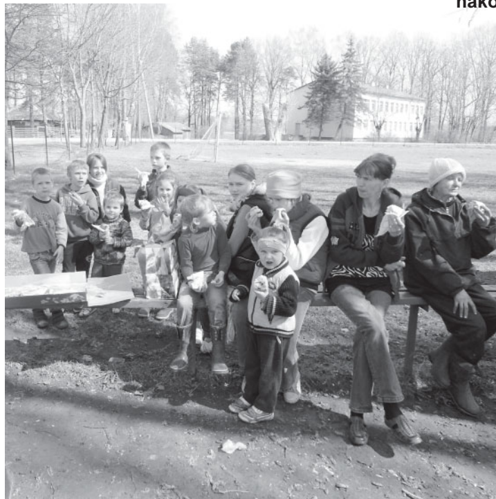
Pēc kārtīga darba, ēdot sarūpēto mielastu, par dabas piesārņošanu spriež lieli un mazi Dāviņu talkotāji.