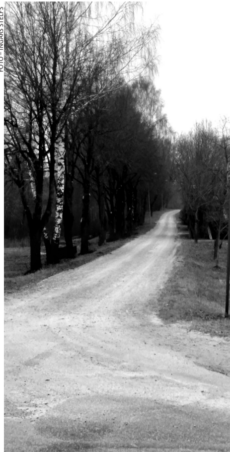
Upes iela Stelpē.