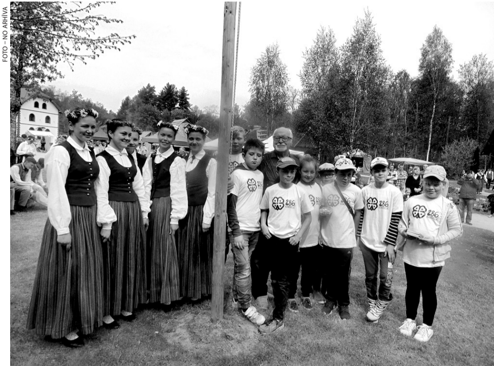
2010. gadā Pļaujas svētkos Ausekļu dzirnavās pēc karoga pacelšanas.

Kopš 2003. gada Latvijas mazpulkos ir izveidots augstākais apbalvojums «Goda nominācija», pa-