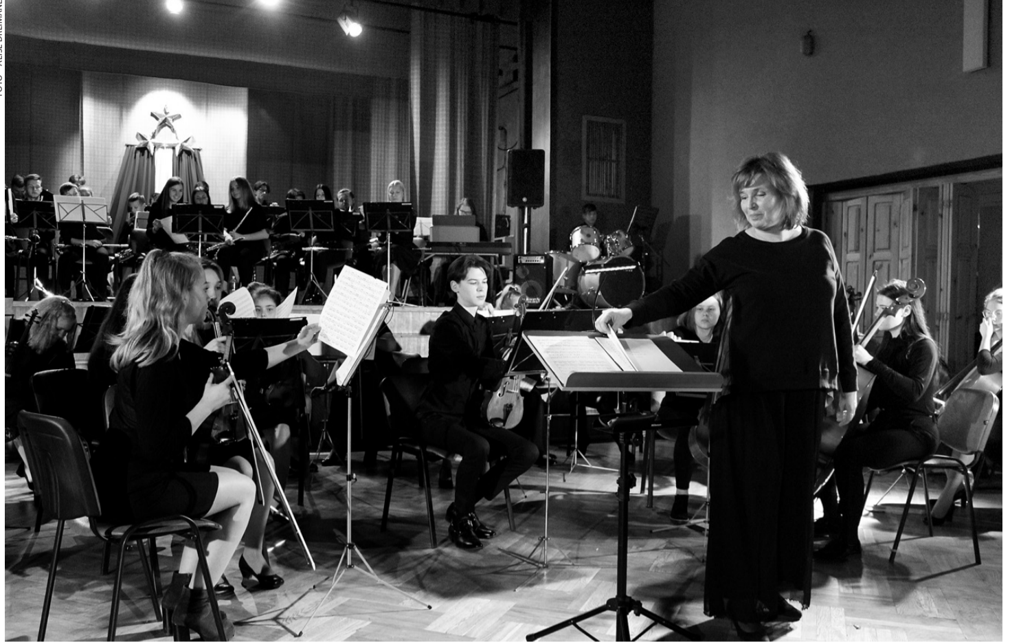
Svētku koncertā Misā patriotiskus un pazīstamus muzikālos skaņdarbus izpildīja apvienotais Baldones un Vecumnieku novada jauniešu simfoniskais orķestris «Draugi».