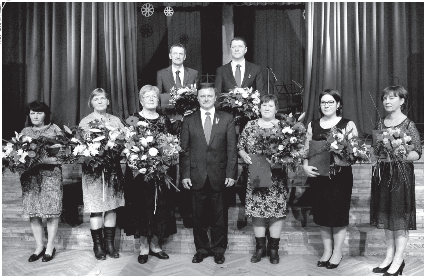
«Vecumnieku novada domes Goda rakstus» saņēma iedzīvotāji, kuri rūpējušies par novada attīstību un atpazīstamību.

Atzīmējot Latvijas valsts 101. dzimšanas dienu, Vecumnieku novadā godināja iedzīvotājus, kuru profesionālais darbs un ieguldījums kopējās labklājības celšanā šogad ir augstu novērtēti. Tika novērtēti arī viņu ieguldījums novada attīstībā un popularizēšanā un izteikta pateicību ikvienam, kurš šī gada laikā ar savām gaišajām domām, labajiem vārdiem un darbiem ir stiprinājis Vecumnieku novadu. Tikai visi kopā mēs esam spēks!