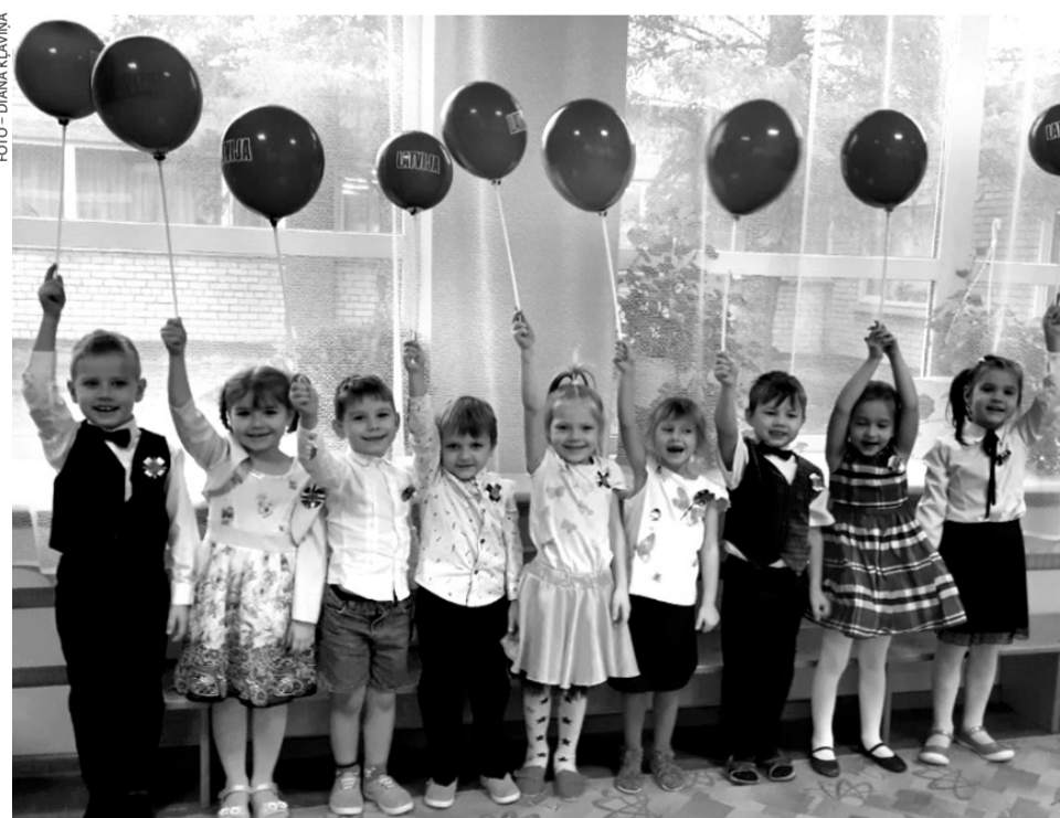
Grupas «Rūķi» audzēkņi sūta sveicienus Latvijai dzimšanas dienā!