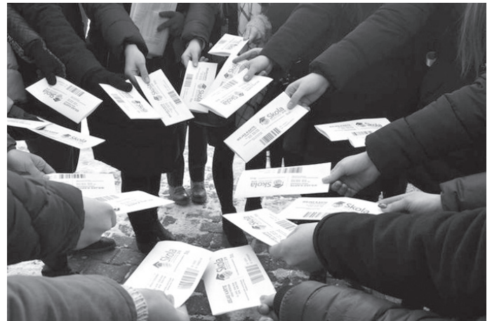
Biļetes uz izstādi iegādātas ar Eiropas fonda atbalstīta projekta finansējumu.

Jaunieši, kas nākotnē vēlas apgūt profesiju skaistumkopšanas vai medicīnas nozarē, Latvijas Universitātes Paula Stradiņa Medicīnas koledžas standā varēja vērot, kā strādā topošie skaistumkopšanas speciālisti kosmetoloģijā, masie-