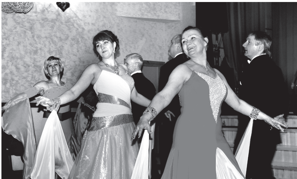
Īslīces sarīkojumu deju dejotāji raisīja publikas ovācijas.