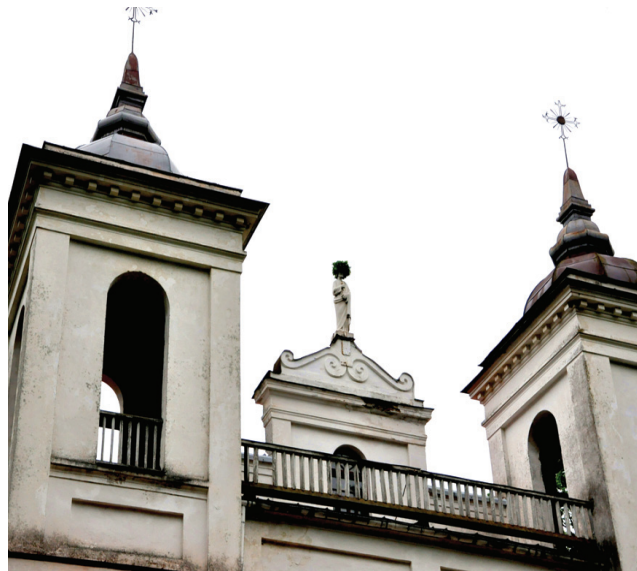
Ja ieskatās – par Svētajam Pēterim ozollapu vainags.