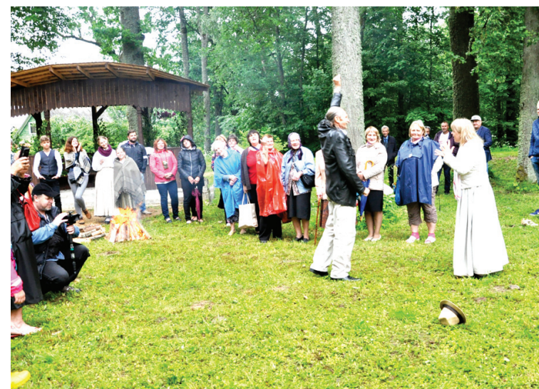
Notiek zilēšana, vai vīru vēlmes piepildīsies, diemžēl cepure krita uz sāna.

IEVA PANKRATE, Sabiedrisko attiecību nodaļas vadītāja pienākumu izpildītāja