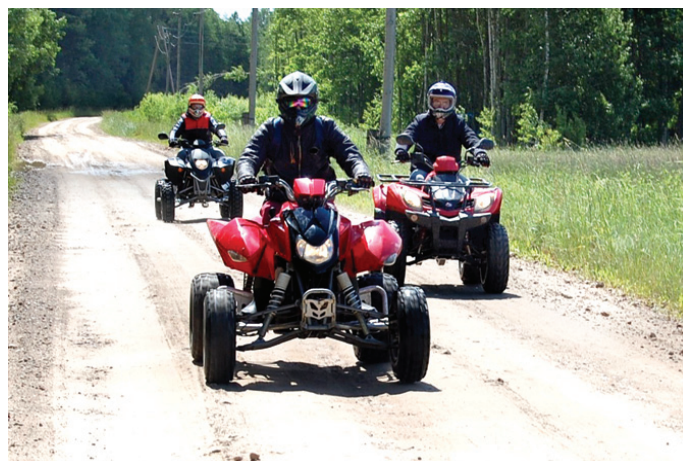
«Green Road Trips» kvadraciklistu izbrauciens.