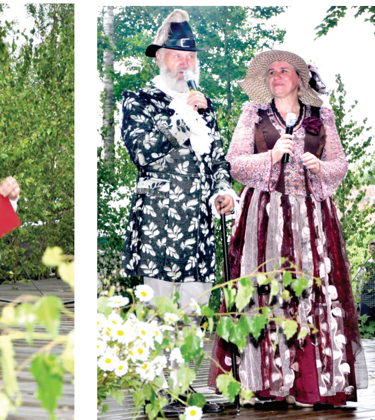
Barons Hāns ar baronesi stāsta leģendu.

lais ansamblis «Vēl mazliet» priecēja ar skanīgām dziesmām.