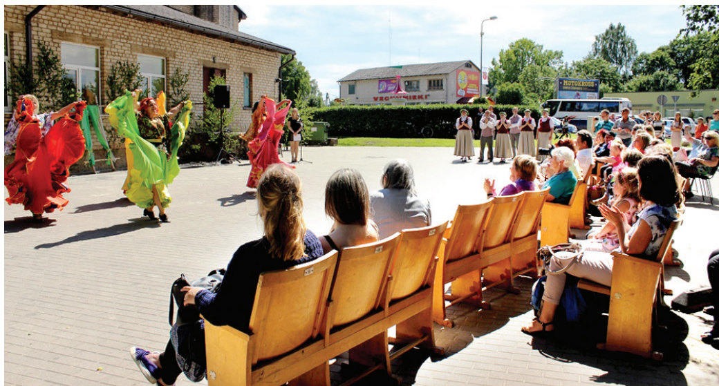
Ar karstasiņģu priekšnesumu klātesošos aizrāva eksotisko deju centra «Alegria» dejotājas.

Pirmajā svētku dienā ar vadmotīvu «Svētku lilija pumpurā!» organizatori vērsa uzmanību tieši uz mūsu mazajiem «pumpuriņiem» – bērniem un viņu ģimenēm. Ceturtdienas pēcpusdienā notika dažādas radošas aktivitātes bērniem un jauniešiem, kurās ikviens varēja pilnveidoties, darinot sev noderīgas mantas. Šajā radošajā pēcpusdienā bērni varēja baudīt nedalītu savu vecāku, vecvecāku un radošo pedagogu uzmanību, apgleznojot plakanos Baltijas jūras