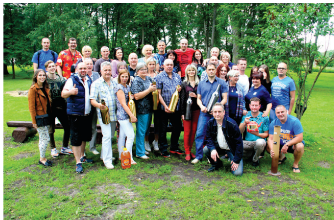
Kuplais šautriņmetēju pulks ar kausiem dienas noslēgumā.