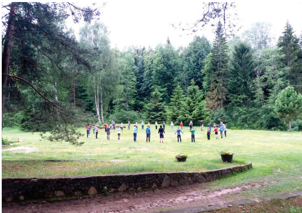
Rīta vingrošana viesu namā «Satekas».