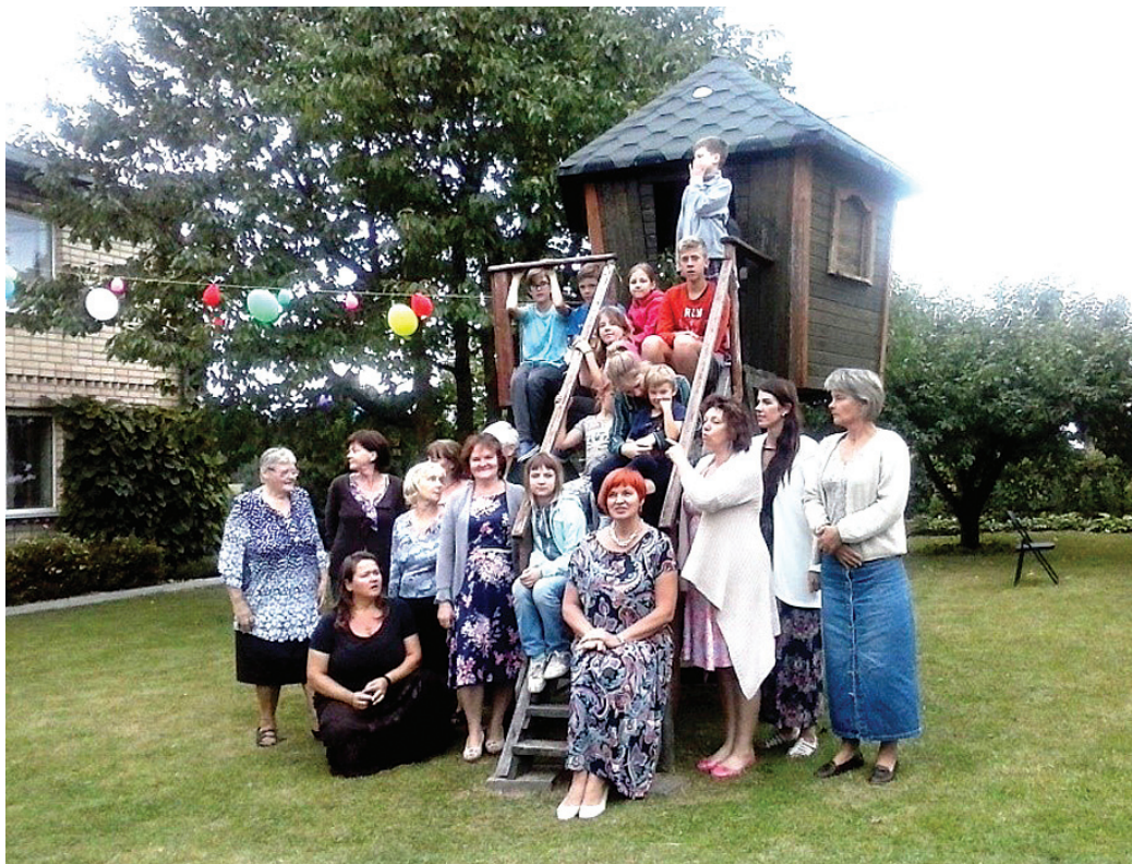
Vecmāmiņas ar mazbērniem pēc darbīgām dienām 2016. gada nometnē.

• plkst. 17 – 19 brīvais laiks, draudzēšanās, diskusijas un vakariņu pagatavošana pēc vecmāmiņu receptēm;