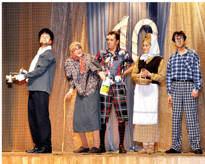
Skaistkalnes tautas nama aktieri klātesošos aicināja doties ceļojumā ar 10. ilgu tramvaju.