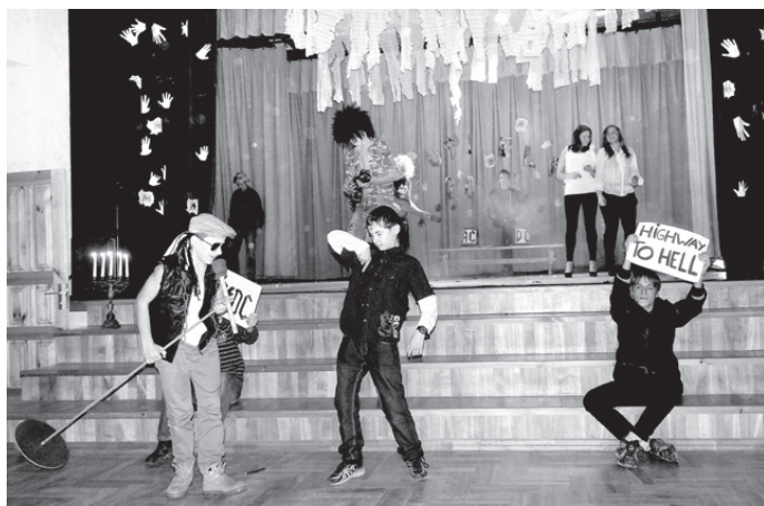
Skaistkalnes vidusskolas 8. klases skolēni tika pie visrožīgāko dalībnieku titula.

○ «Popielā» – krāsaini un pārdomāti priekšnesumi