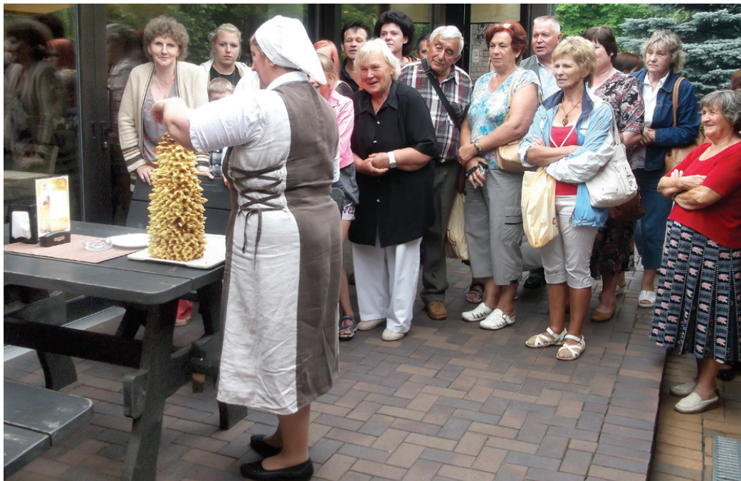
Nu arī Beibežu bibliotēkas lasītāji zina, kā top lietuviešu nacionālais gardums «Šakotis».

Čaklākie lielie un mazie lasītāji, kuri iesaistījušies lasīšanas veicināšanas programmā «Bērnu un jauniešu žūrija», vasarā devās ekskursijā uz Lietuvu. Ceļojums sākās ar Skaistkalnes Romas katoļu baznīcas apmeklējumu. Rokiškos bija iespēja apskatīt pilsmuižas ansambli un iepazīt siera gatavošanas tradīcijas. Aukšaitijas na-