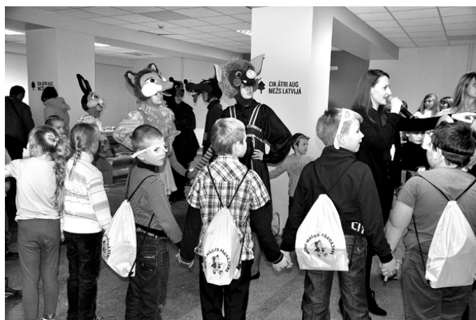
Konkursa «Mūsu mazais pārgājiens» dalībnieki kopā ar pasaku tēliem jāvās jautrām dejām.