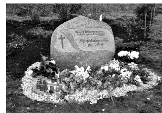
Piemiņas akmens pie Valles baznīcas.