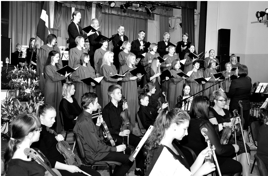
Lielkoncerta pirmajā daļā sarīkojuma apmeklētājus priecēja jauktā kora «Maldugunis» dziedājums un simfonisko orķestru izpildītie skaņdarbi.