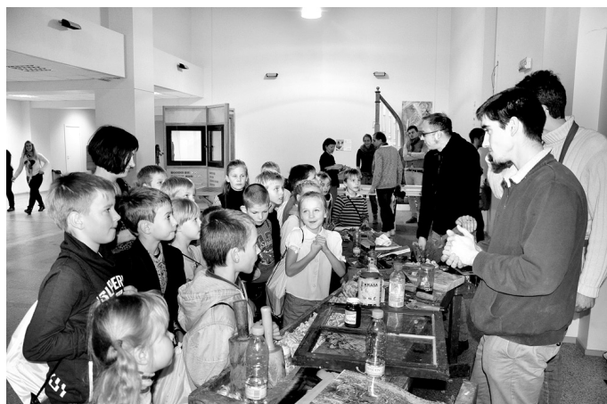
Skolēniem vislabāk patika aktivitātes kokapstrādes darbnīcās.

A. STAŠKEVIČA, Vecumnieku vidusskolas 2.a klases audzinātāja