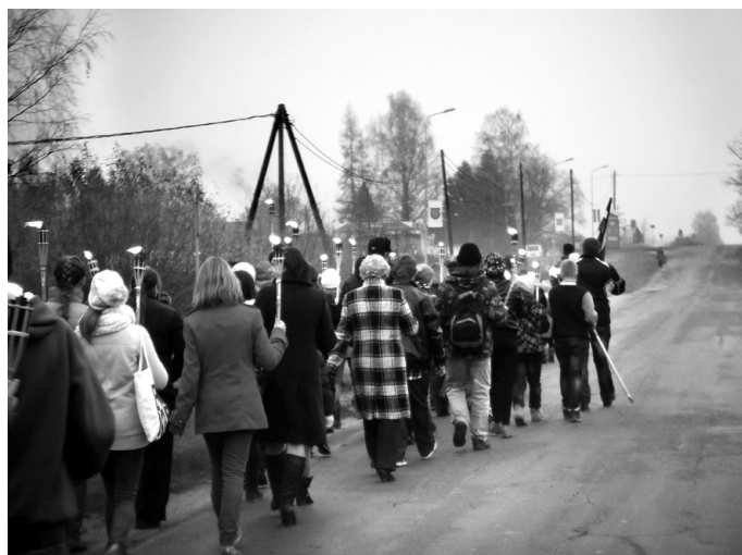
Lāpu gājiens pelēkajā 11. novembra pēcpusdienā apliecināja – Valles pagasta ļaudis tur godā par Latvijas brīvību kritušo kareivju piemiņu.