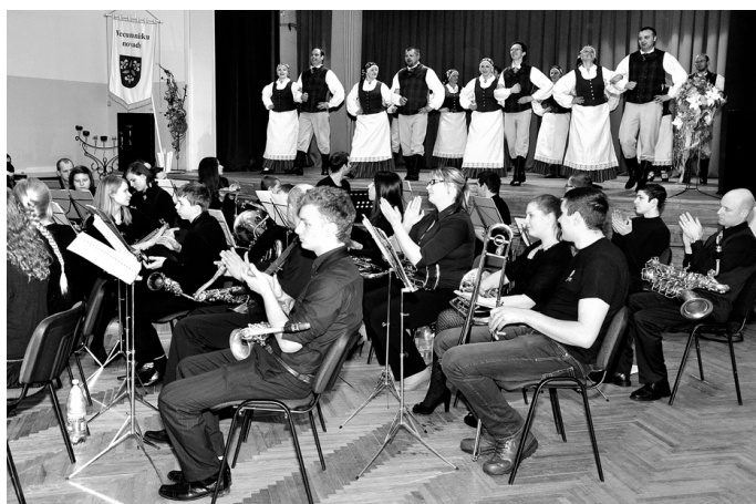
3. martā Vecumnieku tautas namā izskanēja koncerts «Ceļā uz Dziesmu un deju svētkiem».