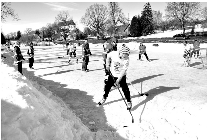
Vairāk nekā četras stundas uz ugunsdzēsēju dīķa Skaistkalnē valdīja hokeja kaislības.