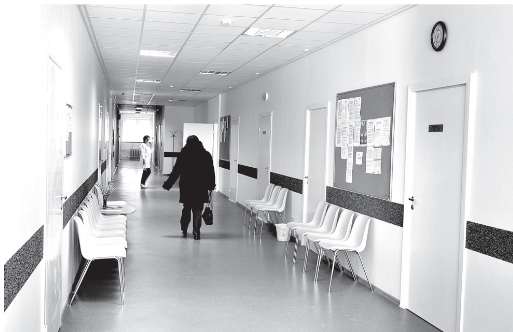
Pēc kosmētiskā remonta Veselības centra otrā stāva koridors kļuvis mājīgāks un mūsdienīgāks.

Rentgenoloģijas kabineta darba laikā – pirmdienās no plkst. 13 līdz 15 un otrdienās no plkst. 8.30 līdz 12 – var veikt rentgenoloģiskos izmek-