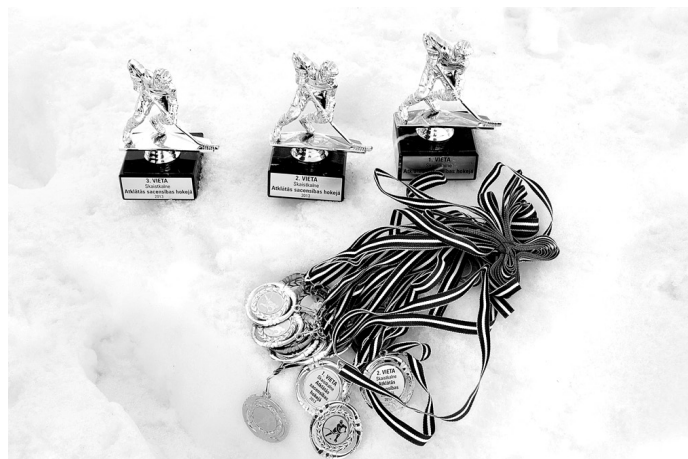
Balvas un medaļas turnīra veiksminiekiem bija sarūpējusi Vecumnieku novada pašvaldība.

Ē. ČERPINSKIS, sporta darba organizators Bārbeles un Skaistkalnes pagastā