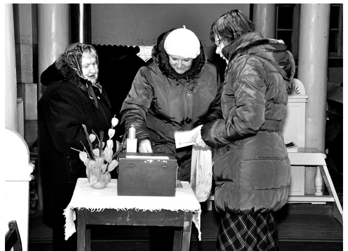
Dievnama apmeklētāji, nākot uz koncertu 6. janvārī, ziedošanu kastītēs labprāt ievietoja kādu latu baznīcas restaurācijai.