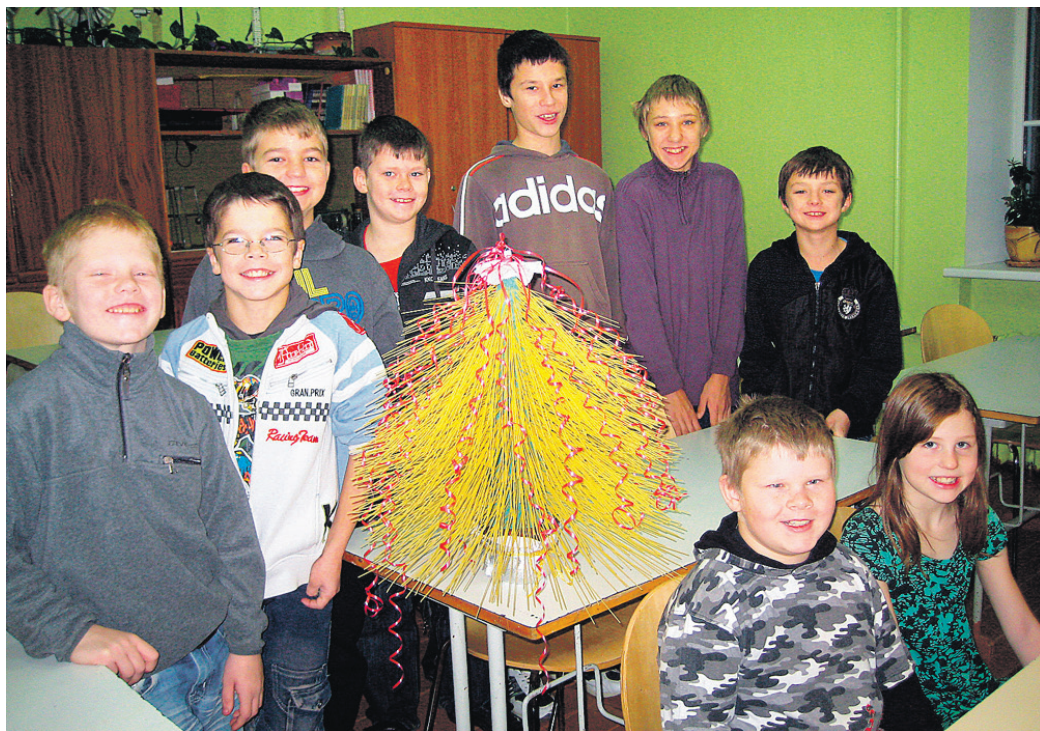
Stelpes pamatskolas 4. klases skolēni izgatavoja eglīti no makaroniem.

○ Skolu apciemo žurnāla redakcijas darbinieki