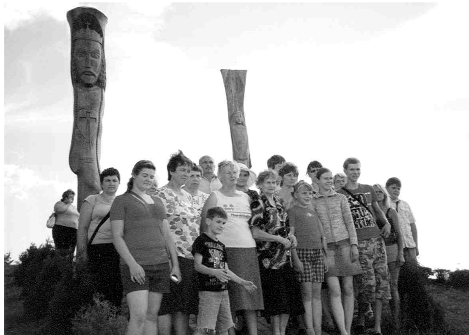
Karaļa kalnā netālu no Aglonas.