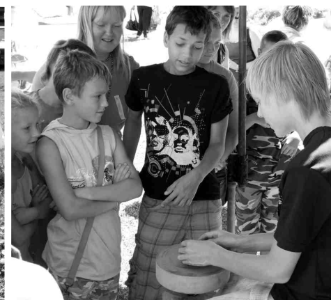
☒ Gatīš gatavo māla bļodiņu. Sadzīviskas ainas no slovāku dzīves. ☒ Sāls baznīcā dziļi pazemē.