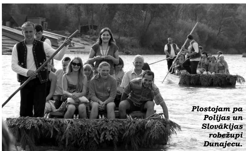
Plostojam pa Polijas un Slovākijas robežupi Dunajecu.