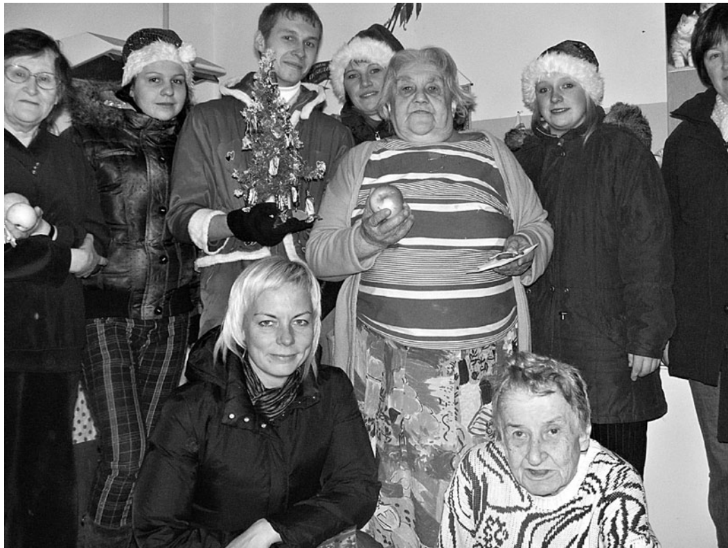
Saulaines profesionālās vidusskolas jaunieši ar Rundāles novada domes Sociālā dienesta darbiniecēm sveic novada vientuļos pensionārus pirmsziemassvētku laikā (plašāk 6.lpp)

Šajā gadā Rundāles novada dome plāno iesniegt arī daudzus jaunus projektu pieteikumus, tādās jomās kā ūdenssaimniecības uzlabošana, ielu apgaismojuma rekonstrukcija, siltumapgādes efektivitātes uzlabošana, alternatīvās sociālās aprūpes sistēmas uzlabošana, kā arī dažādi projekti kultūras jomā.