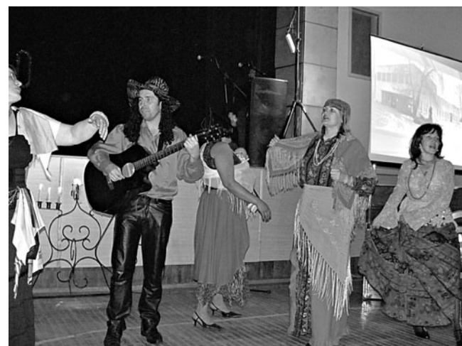
Svitenes amatiereteātra „Šurumburums” sveiciens

Godinot šo desmit gadu kultūras atdzimšanas jubileju, bija ieradies prāvs apsveicēju pulks – gan Rundāles novada amatieru kolektīvi, gan arī kolektīvi no kaimiņu novadiem.