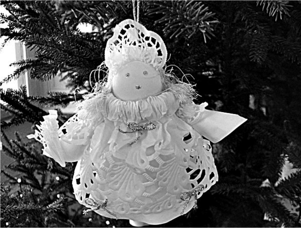
Rundāles pils Ziemassvētku egles rotājums, ko gatavojuši Rīgas nedzirdīgo skolas un Strazdumuižas internātskolas vājredzīgie un neredzīgie bērni