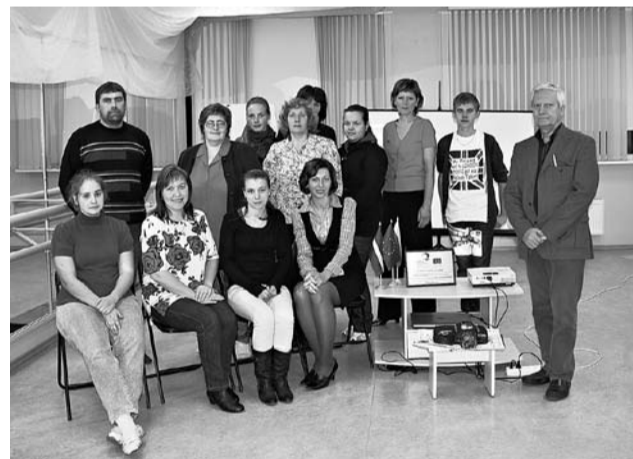
Fotokursu līmeņa I grupas dalībnieki finišē ar z/s „Strīķeri” dāvāto marcipāna fotoaparātu NIKON D700