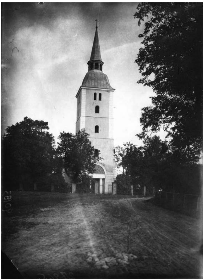
Mežotnes baznīca 20. gadsimta 30-tajos gados

Šā gada 12. oktobrī Rundāles novada dome organizēja diskusiju „Mežotnes baznīca – Lielupes augšteces kultūrvēsturiskā tūrisma piedāvājuma sastāvdaļa”. Sanāksmes ietvaros tika diskutēts par Mežotnes baznīcas un tai pieguļošās teritorijas iespējamiem attīstības virzieniem.