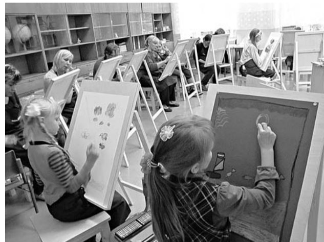
Mākslas nodarbību dalībnieki izmēģina iegādāto aprīkojumu – top pirmie radošie darbi ar pasteļkrāņiem

Lai nodrošinātu augstākminētās aktivitātes, projekta ietvaros ir iegādātas mēbeles un aprīkojums mākslas nodarbībām, kā arī fotoaprīkojums foto nodarbību nodrošināšanai par kopējo summu 12 438,77 latī.