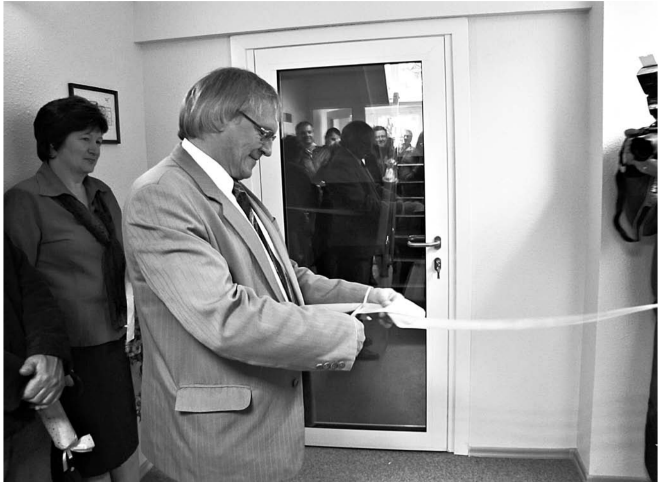
13. septembrī svinīgā pasākumā tika atklāts Saulaines sociālais centrs. Plašāka informācija par centra atklāšanu 5. lpp