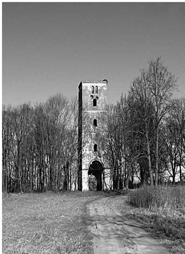
Mežotnes baznīca 2009. gadā