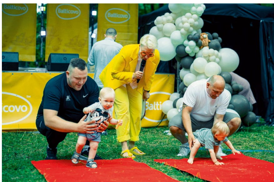
Ģimenes diena dāvā aktivitātes dažāda vecuma bērniem. Kā nu bez rāpošanas sacensībām!