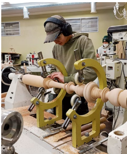
Tehnikuma jauno meistaruru rokām top priekšmeti Iecavas luterāņu baznīcas atjaunošanai.

Iecavā sportiskais gars ir dzīvs jau izsenis, un dažādi sporta veidi kļuvuši par neatņemamu ikdienas daļu daudziem novada iedzīvotājiem. Basketbols, vieglatlētika, galda teniss, velosports, futbols, hokejs, jāšanas sports un citas aktivitātes veido plašu un daudzveidīgu sporta vidi. Jaunā paaudze aktīvi iesaistās sporta skolā "Dartija" un futbola klubā "Iecava", savukārt biedrības "Velo Iecava" un "O-Upmale" uztur un attīsta velobraukšanas un orientēšanās tradīcijas. Pavasaros Iecavas upē notiek airēšanas slaloma sacensības "Iecavas čempionāts", ko organizē klubs "Brīvie ūdeņi".