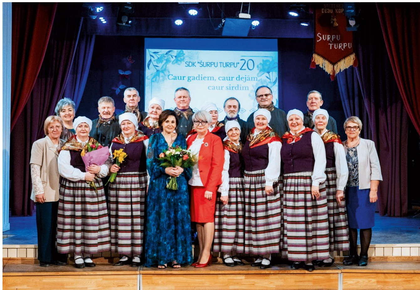
20 gadu pastāvēšanu svinēja senioru deju kolektīvs "Šurpu turpu".